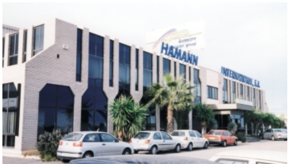
INTERSPE HAMANN group - Betriebsgebäude Valencia

Die permanenten Veränderungen verlangen schnelle Anpassungen der Logistikdienstleister. Genau aus diesen Gründen investierte IHG kontinuierlich in technologische Innovationen und in die Infrastruktur, um somit den Anforderungen des Marktes gerecht zu werden. Der Kunde kann einzelne Produkte auswählen oder alles mit allem kombinieren. Er kann sich aber auch zurücklehnen und vom Consulting bis zur Konzepterarbeitung und der Umsetzung alles von IHG machen lassen. Die Firmen aller Bereiche überarbeiten ihre Strategien und benötigen Dienst-