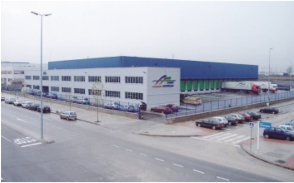
INTERSPE HAMANN group - Niederlassung Madrid

zu Hause ist, wo der Kunde zu Hause ist, heißt er für die IHG in Spanien „vivir en movimiento“. Er steht für die Philosophie der Gruppe und bringt auf den Punkt, was sich die IHG auf ihre Fahnen geschrieben hat.