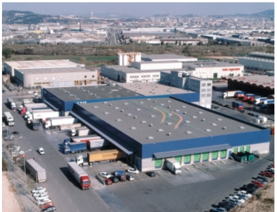
INTERSPE HAMANN group Barcelona

Zum Jahresende 2000 haben wir uns für eine Zusammenarbeit mit der INTERSPE HAMANN group Spanien entschieden. Durch diese Entscheidung haben wir uns neue Wege geschaffen, um am Markt Stuttgart eine bedeutende Rolle im Spanien Verkehr einzunehmen. Für die exportierende und importierende Wirtschaft in unserer Region bieten wir damit einen bedeutenden Wettbewerbsvorteil.